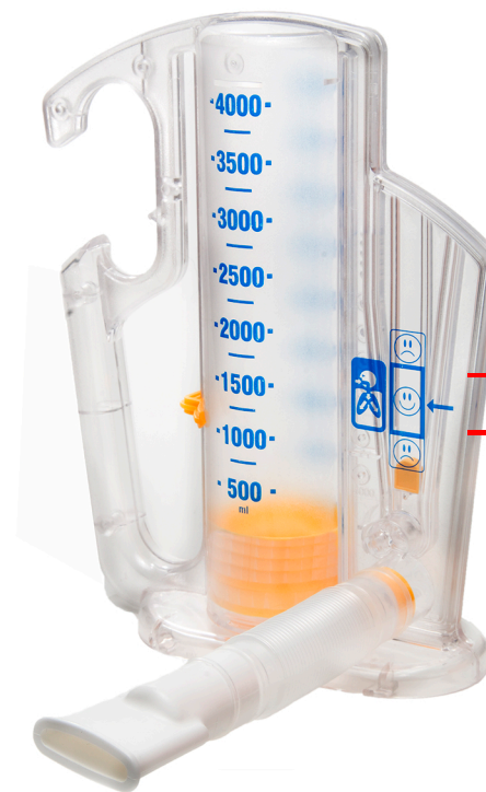
Рис. Пример стимулирующего спирометра

Поставьте отметку на уровне, который достиг поршень, на вашем стимулирующем спирометре. Это будет вашей целью в следующий раз.